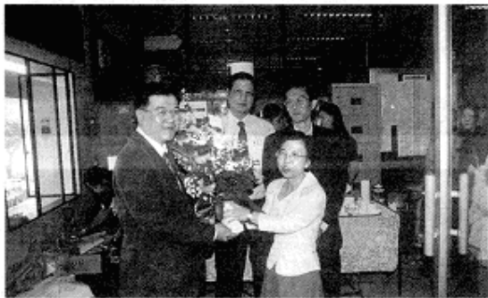
ออมร. โดยกรรมการและเจ้าหน้าที่ ร่วมแสดงความยินดี คณะสังคมนตรีฯ ในโอกาสครบรอบ 35 ปี เมื่อวันที่ 17 กุมภาพันธ์ 2543