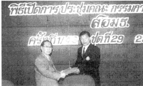
ออมร. เลือกองค์ประธานกรรมการ และเลขานุการ พร้อมแต่งตั้ง คณะอนุกรรมการชุดต่าง ๆ 8 ชุด (อ่านต่อหน้า 2)