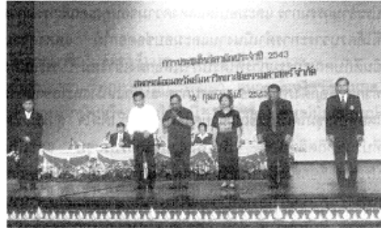
ออมร. ประชุมใหญ่สามัญประจำปี เมื่อวันที่ 18 กุมภาพันธ์ 2543 อนุมัติจ่ายเงินปันผล 13% เงินเฉลี่ยคืน 12% (อ่านต่อหน้า 4)